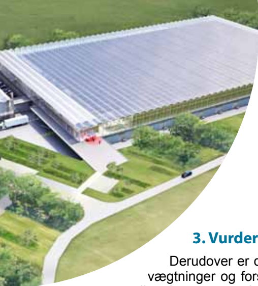
Pigcity, Illustration, fra Realdania fremtidsgaarde.dk