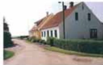
Det Skjærgadestræde i Ringgaden åbnes for udgang over markerne og åbner mod Stryne Kule.