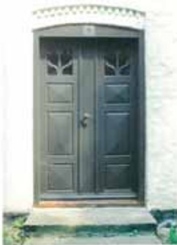
Livstræspøssen er et særkende for denne vinduesindretning på Strynø.

Fra midten af 1800-årene havde øhavets hurtigt voksende handelsflåde behov for arbejdskraft. En del af befolkningstilvæksten på Strynø fandt beskæftigelse ved at tage lyre i flåden, og kunne derved forhåbentlig på den i stedet for at rejse væk. Mere og mere godstransport flyttede dog efterhånden over på de mange jernbaner, som blev anlagt i perioden ca. 1870-1910, og da handelsflåden efterfølgende gik fra søj til motor, vandt behovet for arbejdskraft ind.