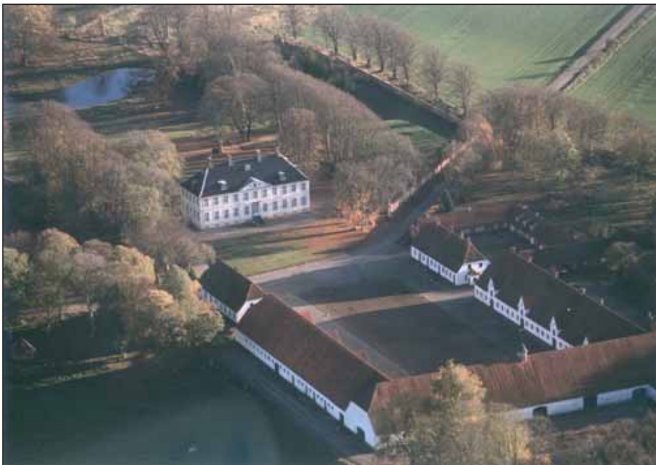
Hagenskov Gods. Hovedgårdene udgør med deres smukke arkitektur og store landskabsrum et traditionelt anerkendt kulturmiljø.