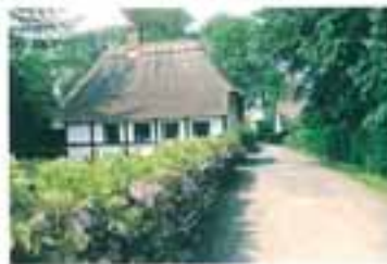
Op ad Kirkevej hænger blåvejens græskar. Huset er nu over tagetøkket.

Indtil omkring 1850 blev de fleste huse bygget af Pø' Bager. Hans huse var små øst-vestorienterede bygninger med lave halvvalnede tage. De havde ofte fjernt søkket, pudset og hvidkalket murværk og grønmalte vinduer med to spjæsnede rammer. Malt på en af husets langsider sad en trefløjet indgangsdør med ruder ovenpå, hvori var indfældet den for Strynø karakteristiske Livstræspøssen. Sokkelstenene var gendrag fra stengårdene mellem gårdflokkene.