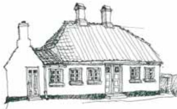
På Stryngade er et andet af de små sømandshuse indfaldet. Her forenes med et højt skovtræspil og det karakteristiske, tværsnitlige søkket.

Livstræspøssen fra Strynø er kun registreret et enkelt sted uden for øen, så spjæsnestenen har været at finde blandt andre smedene.