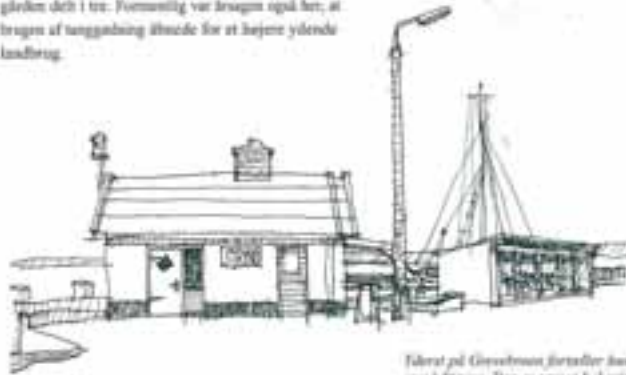
Tilvært på Grevensboen fortæller havens skik, at så er på Strynø. Der er særlig behagelige for gamle og gamle cykler, men de passer deres arbejde i Rindholm.

Strynø Kalv har i årtusinder solgort et lille mikro-klima - hvor øens beboere i princippet har kunnet leve hele livet, fra fødsel til død, alene under himlens store bue.