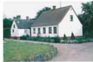
På Skippersvej 5 står dette lille, fine og velbevarede bygningssøskende.