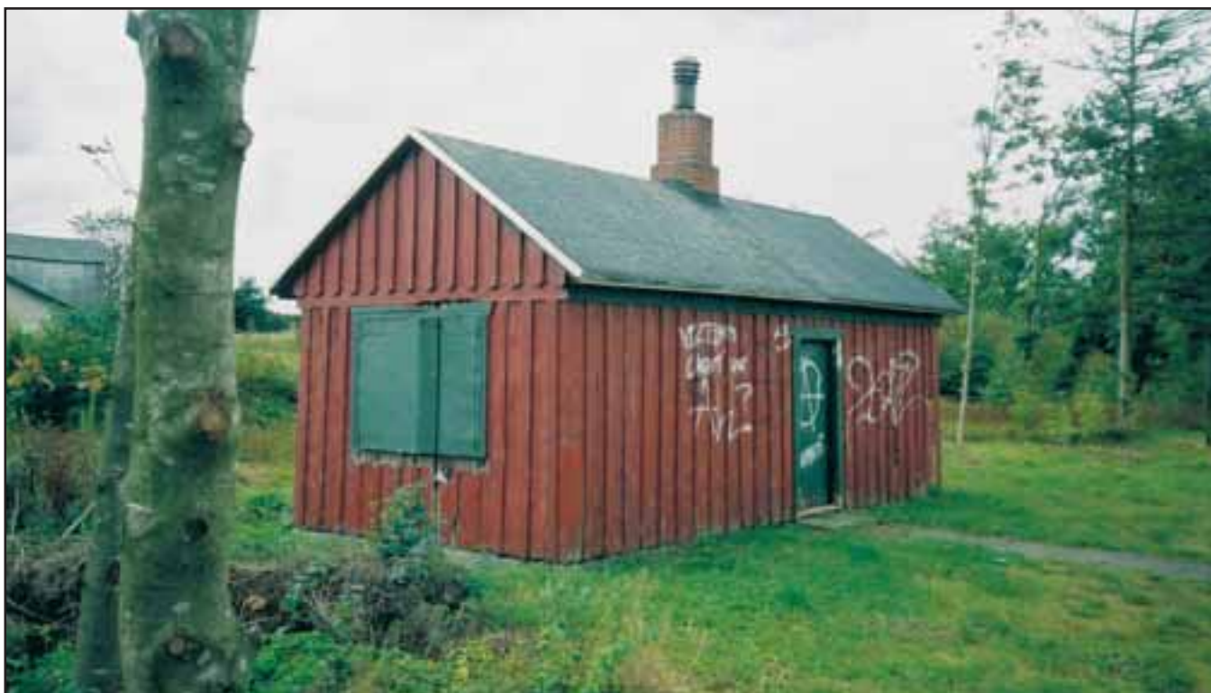
DSB-kolonnebus i Hjern. Ydmyge bebyggelser som landarbejderbuse, kolonnebuse og fiskerhytter bringes i disse år mere og mere i fokus som relevante kulturmiljøer.