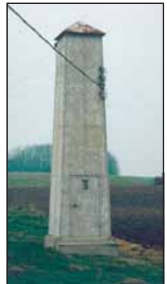
„Himmelarkitektur“—Transformatorårne i Skive Kommune.