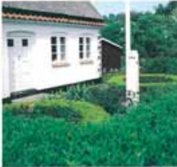
Sirlig omgængende forhave forekommer mange steder på Strynø. Som her ved Mallevågen.