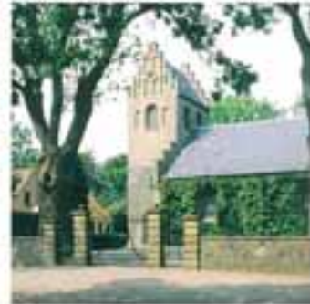
Stryne kirke ligger smukt bag kirkepladsens højstener.

På brovejen oplyses et lille lev- og pakhus, som i en senere version står på samme sted. Byen fik stempeltrykning omkring 1925, og telefon og el i begyndelsen af 1930'erne. En bil- og julehavn på sydbroen er anlagt i 1920'erne. I 1954 blev der indført et egentlig fergeselskab for at lette af- og tilkørslen. Stryne fik egen hillerige i 1966, da Syd-fynske Dampskibsselskab opførte med besejlingen.