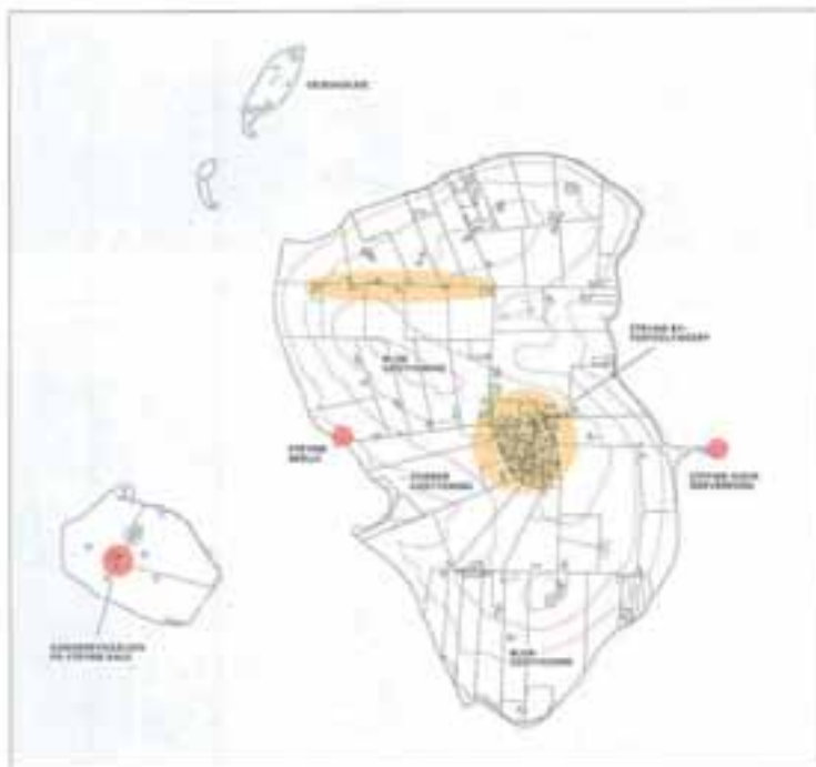
Strynø og Strynø Kalv. 1:20.000