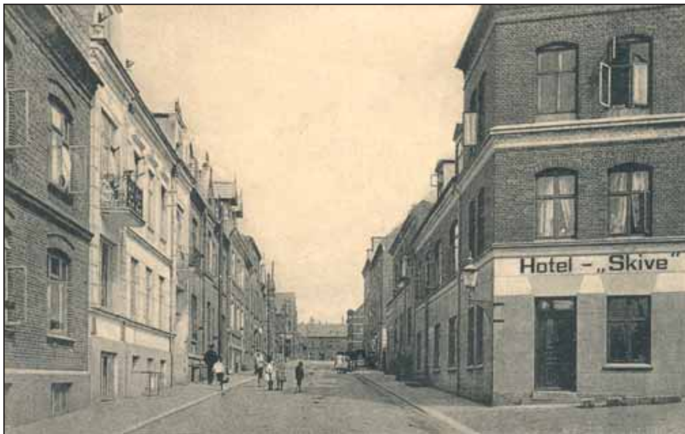
Voldgade i Skive. Historiske fotos er ofte rige på detaljer og informationer om den oprindelige arkitektur.

2000 - Landskabs-konventionen (Firenze) har som formål at sikre en bæredygtig landskabsbeskyttelse gennem beskyttelse, forvaltning og planlægning. Landskabet betragtes som en vigtig komponent i livskvaliteten og for den lokale identitet. Derfor skal landskabspolitikken, der bygger på offentlighedens inddragelse, integrere landskabet i den fysiske planlægning, i kultur- og miljøpolitikken samt i de sektorpolitikker, der i øvrigt har betydning for landskabets udvikling. Offentlighedens forståelse for landskabsværdierne skal styrkes, og der skal opstilles landskabskvalitetsmål og udvikles de nødvendige redskaber til implementeringen af mål og politikker. Konventionen, som er ratificeret den 20. marts 2003, har relationer til Den Europæiske landskabs- og biodiversitetsstrategi.