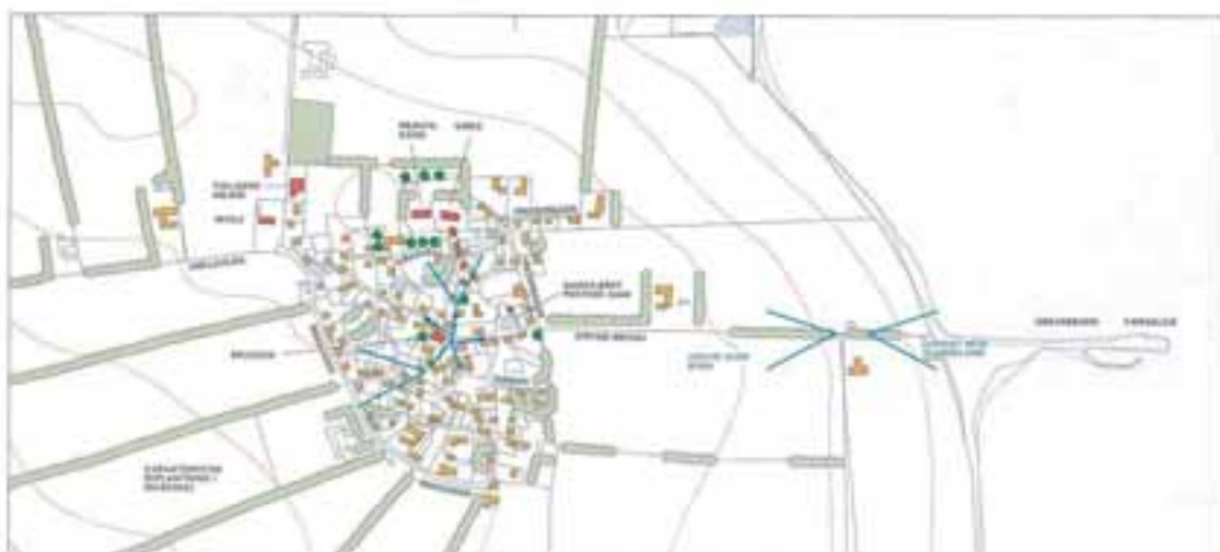
Stryne By, 1:8.000